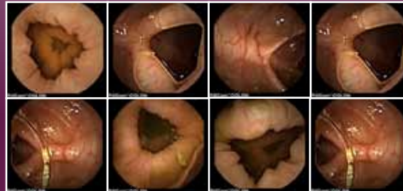
PillCam kapszula-endoszkóp felvételek

A kapszula közel 9 órán át üzemel, majd spontán ürül ki a szervezetből a végbélen keresztül. A vizsgálat így teljesen fájdalommentes és sem levegő befúvásra, sem RTG sugárzásra nincs szükség.